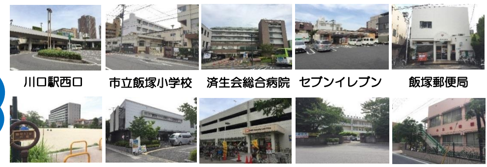
川口駅西口 市立飯塚小学校 済生会総合病院 セブンイレブン 飯塚郵便局 飯塚3丁目公園 川口浮間ゴルフ場 オーケーマート 市立西中学校 共生幼稚園